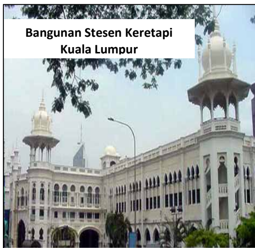
Bangunan Stesen Keretapi Kuala Lumpur